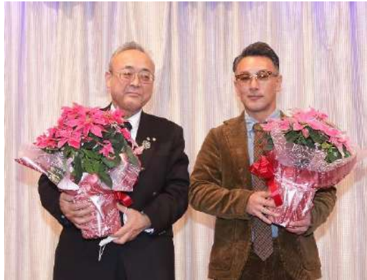
12月結婚記念月御祝 ↑ 12月誕生御祝 →